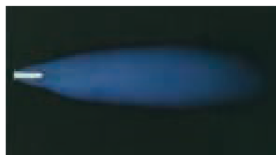
Flamme oxydante (mal réglée)

Réglage pressions et débits : voir préconisations constructeur