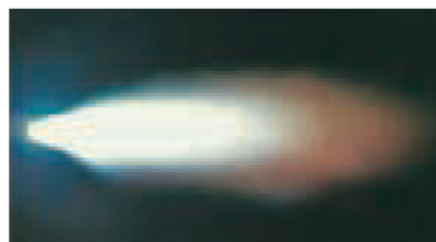
Flamme carburante (mal réglée)