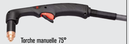
Torche manuelle 75°

(pour plus d'options de torche, consulter www.hypertherm.com )