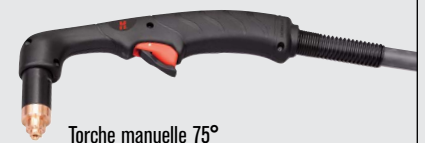
Torche manuelle 75°

(pour plus d'options de torche, consulter www.hypertherm.com )