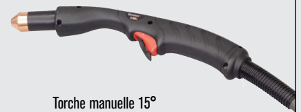
Torche manuelle 15°