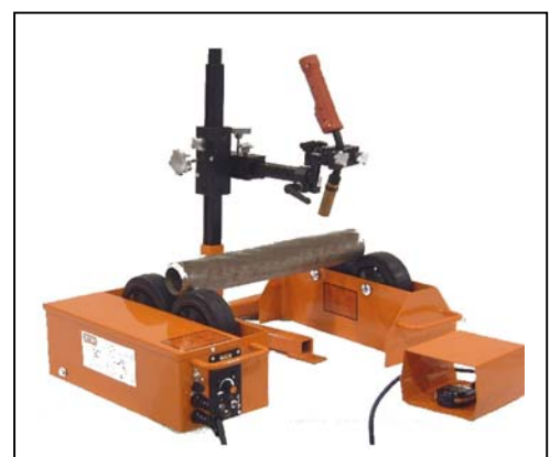
KR-200 avec support de torche FSM700 en option